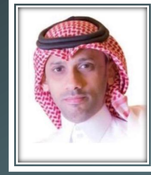
نائب الرئيس الاستاذ/ شامي بن هادي زكري